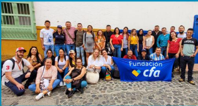
Recorrido Santa Fe de Antioquia con Aliados y Juventudes

Durante el 16 y 17 de noviembre de 2022 se llevó a cabo en Medellín el segundo encuentro de aliados y juventudes, con el objetivo de mostrar los avances del proceso, validar las temáticas elegidas por los jóvenes en territorio, y fortalecer el relacionamiento entre entidades y jóvenes participantes.