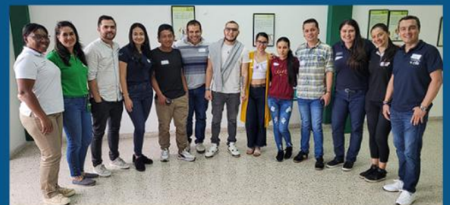
Encuentro en el municipio de Tuluá - Valle del Cauca.