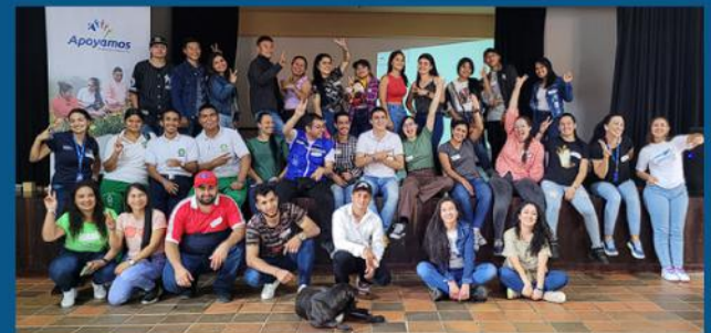
Encuentro en el municipio de Hispania.