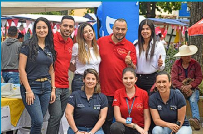
Feria de emprendimiento juvenil en Andes

Durante el segundo semestre de 2022, se apoyó el desarrollo de 4 ferias de emprendimiento juvenil en diferentes municipios de Antioquia, con aliados como CFA Cooperativa Financiera, Gobernación de Antioquia, Colpensiones y Festival Jibusu. Se contó con la participación de 39 emprendimientos, 122 personas participantes, con un total de venta de $6'425.500